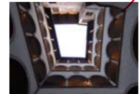
Loggiati: non sporgersi!